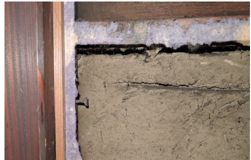
和釘は格子を外す時の為に頭を打ち残している。

糊は正麩糊で、固形の正麩を水に浸けて 一晩おいたものを煮て使いましたが、防腐 剤が入っていないので、何もしないと1週 間程でカビが生えるとのこと。糊を煮 て5~10年寝かせておく古糊は、掛軸や腰 張り等には使いますが、壁紙等に使う糊は 作り立ての強い糊を使います。掛軸や腰 張りに古糊が使われるのは、張り替えられ るように粘着が弱いのと、糊が強いと下の汚 れを引っ張って表面にでてしまうからだそ うです。