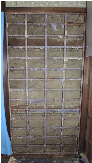
荒壁と貫の前面に、張付壁の下地の格子組が上下各 4 本、縦各 7 本、和釘で打ち付けられていた

格子は内法 1760 mm と柱間 900 mm の間に隙間無く収まり、縦方向は縦框が見付 12 mm で、