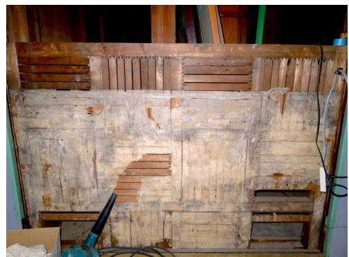
木摺を縦横に市松に配した喜翁閣の張付壁の下地